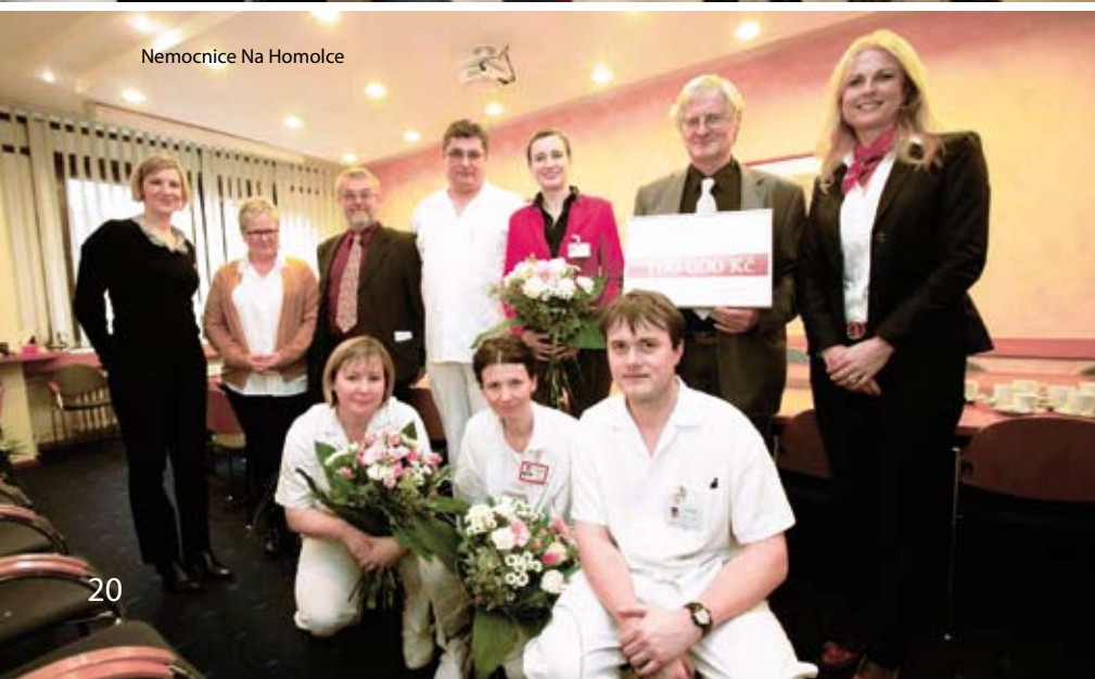
Nemocnice Na Homolce