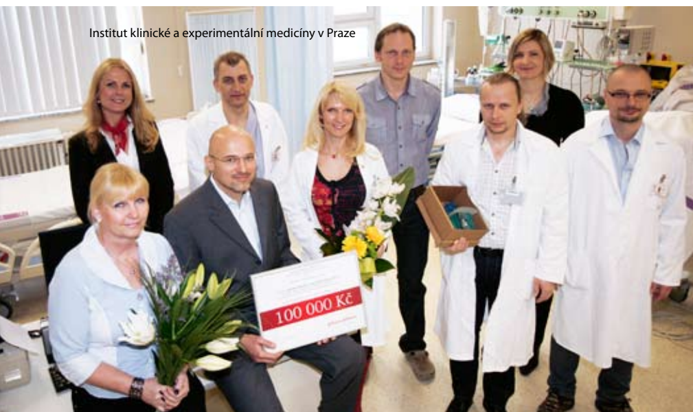
Institut klinické a experimentální medicíny v Praze

Johnson & Johnson je dlouhodobým partnerem projektu Bezpečná nemocnice, který usiluje o zvýšení informovanosti o bezpečí v lůžkových zdravotnických zařízeních. Zároveň je jeho cílem každoročně ocenit nemocnici, která v daném roce v České republice učinila nejvíce kroků ke zvýšení bezpečí pacientů. Pátého ročníku soutěže se zúčastnilo 16 projektů a jeho výsledky byly vyhlášeny koncem ledna 2013 během celostátní konference Dny bezpečí, která je určena pro odbornou veřejnost z oblasti zdravotnictví a zaměřená na problematiku kvality a bezpečí. Absolutním vítězem se stal projekt „Systém evidence a dokumentace práce klinického farmaceuta v Nemocnici Na Homolce – základní nástroj bezpečnosti farmakoterapie“. Druhým nejlépe hodnoceným týmem a současně vítězem technicko-provozní oblasti se stal Institut klinické a experimentální medicíny v Praze s projektem „Elektronická evidence vyhlášky č.11/2005 – zvýšená bezpečnost pacienta, méně práce pro zdravotnický personál“. Oba týmy získaly od společnosti Johnson & Johnson mimořádnou cenu ve výši 100 000 korun, určenou na další odborné vzdělávání.